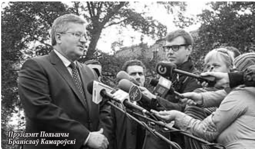
Прэзідэнт Польшчы Браніслаў Камароўскі

Напрыклад, кіраўнік дыпламатычнага ведамства Радослаў Сікорскі да канца галасавання не мог быць упэўнены, што захавае крэсла ў новым урадзе. Але ў выніку яго «Грамадзянская платформа» перамагла, і таму на партыйнай вечарынцы пан Радэк быў у гуморы. Так што я падруляваў у зручны момант. І паколькі ведання польскай бракавала, то нахабна стаў задаваць пытанні па-беларуску. Інтуіцыя падказвала: той наўрад ці скажа, што не разумее, бо будзе выглядаць няёмка (як да Лукашэнкі