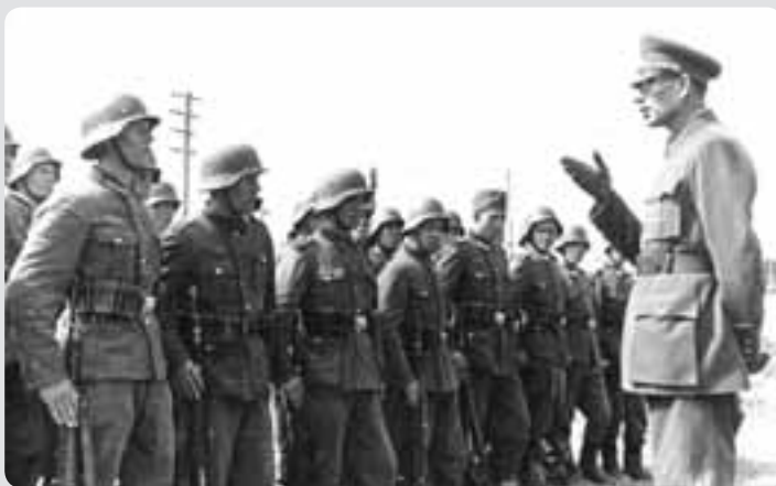
Власов перед бойцами РОА