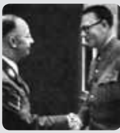
Гиммлер и Власов

Вон как уничижительно высказался о Власове Гиммлер, выступая осенью 1943 года перед гауляйтерами в Познани: