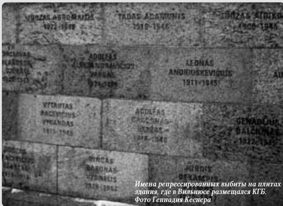
Имена репрессированных выбиты на плитах здания, где в Вильнюсе размещался КГБ.

Еще одно свидетельство — обнаруженная тазобедренная кость убитого, раздробленная не пулей, а металлическим ломом. Это доказательство того, что раненых добивали — не только выстрелом в затылок, но и применяя более «экономные» способы.