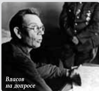
Власов на допросе

Цена за измену? На третий день мы сказали этому генералу примерно следующее: то, что назад вам пути нет, вам, наверное, ясно. Но вы — человек значительный. И мы гарантируем вам, что, когда война закончится, вы получите пенсию генерал-лейтенанта, а на ближайшее время — вот вам шнапс, сигареты и бабы. Вот как дешево можно купить такого генерала! Очень дешево. Видите ли, в таких вещах надо иметь чертовски точный