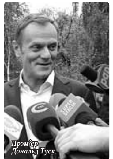
Прэм'ер Дональд Туск