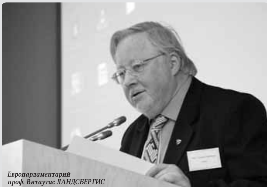
Европарламентарий проф. Витаутас ЛАНДСБЕРГИС

В минуту откровения — всякое лыко в строку, и вот что выяснилось. Как-то, идя по тайге на этих