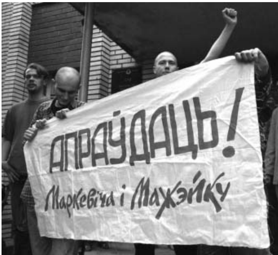
Акцыя салідарнасці з журналістамі «Пагоні»

адміністрацыйнага ціску: ліст чыноўніка да кіраўнікоў дзяржаўных прадпрыемстваў загадваў размяшчаць свае аб'явы толькі ў дзяржаўных СМІ. Пасля чаго з боку дырэктароў прадпрыемстваў прыкметна павяяла халадком. Яны хутка навучыліся арыентавацца ў «правільным» кірунку. Хаця, калі размаўлялі з намі сам-на-