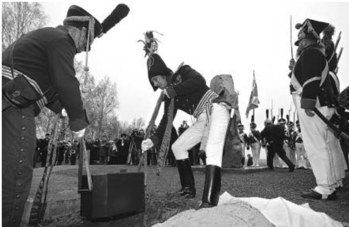
В день 194-й годовщины перехода армии Наполеона через Березину на Брилевском поле Минской области у памятника погибшим здесь воинам состоялась церемония прощания с останками солдат французской армии, которые были найдены в сентябре 2005 года поисковым батальоном Минобороны Беларуси. Минская область, 26 ноября 2006 года

вышел из Смоленска и начался заключительный акт отступления остатков великой армии. Первым испытанием были бои под Красным, вторым — Березина. В обоих случаях, по мнению ближайшего окружения Кутузова, старый фельдмаршал упустил Наполеона.