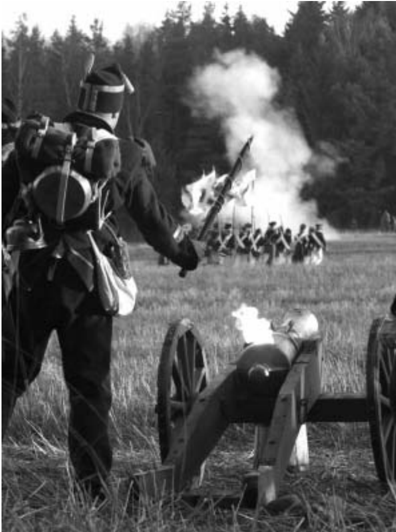
Реконструкія сражэння паміж русійскай і напалеонаўскай арміямі ў студзені 1812 года пасля адступлення французскіх войскаў з Масквы ўздоўж вёскі Студэнка, Борысавскі раён, Мінская вобласць, 17 студзеня 2002 года

Нет дорог? Продвигаться без дорог! Идти к Днепру и перейти через Днепр! Река еще не совсем замерзла? Замерзнет!