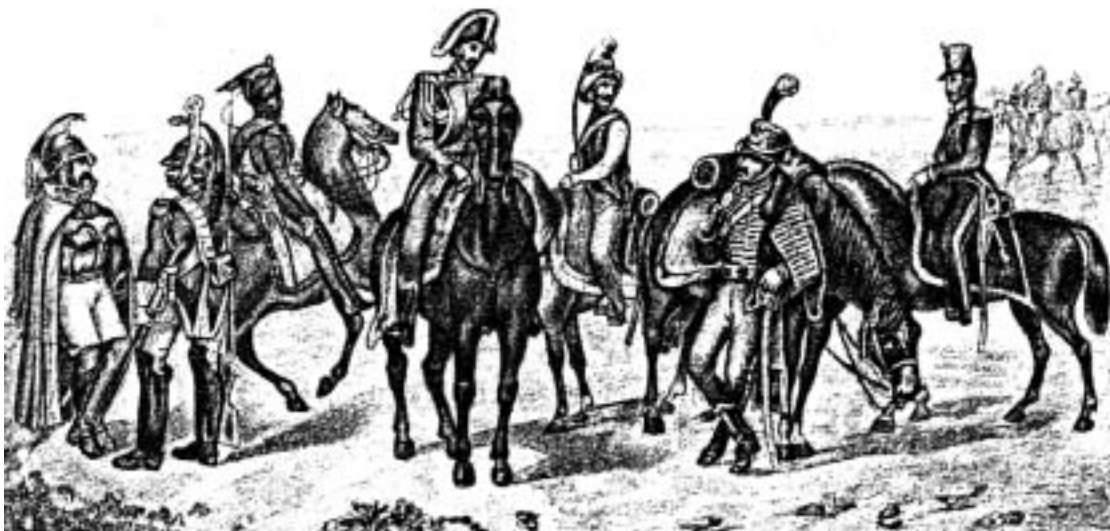
Французская конница при Наполеоне I (слева направо): кирасир, драгун, конный егерь, жандарм, мамелюк, гусар, вожатый (гид)

...14 ноября, после пятидневного пребывания в Смоленске, Наполеон с гвардией вышел из города по направлению к Красному. За ним шли остатки корпусов вице-короля Евгения, Даву, Мюрата. За всей этой армией шел арьергард под начальством маршала Нея, а за Неем двигались русские. Спустя некоторое время Нею суждено было отчаянной борьбой и искусным маневрированием спасти как самого Наполеона, так и те 30–35 тысяч бойцов и 30 тысяч больных, почти безоруж-